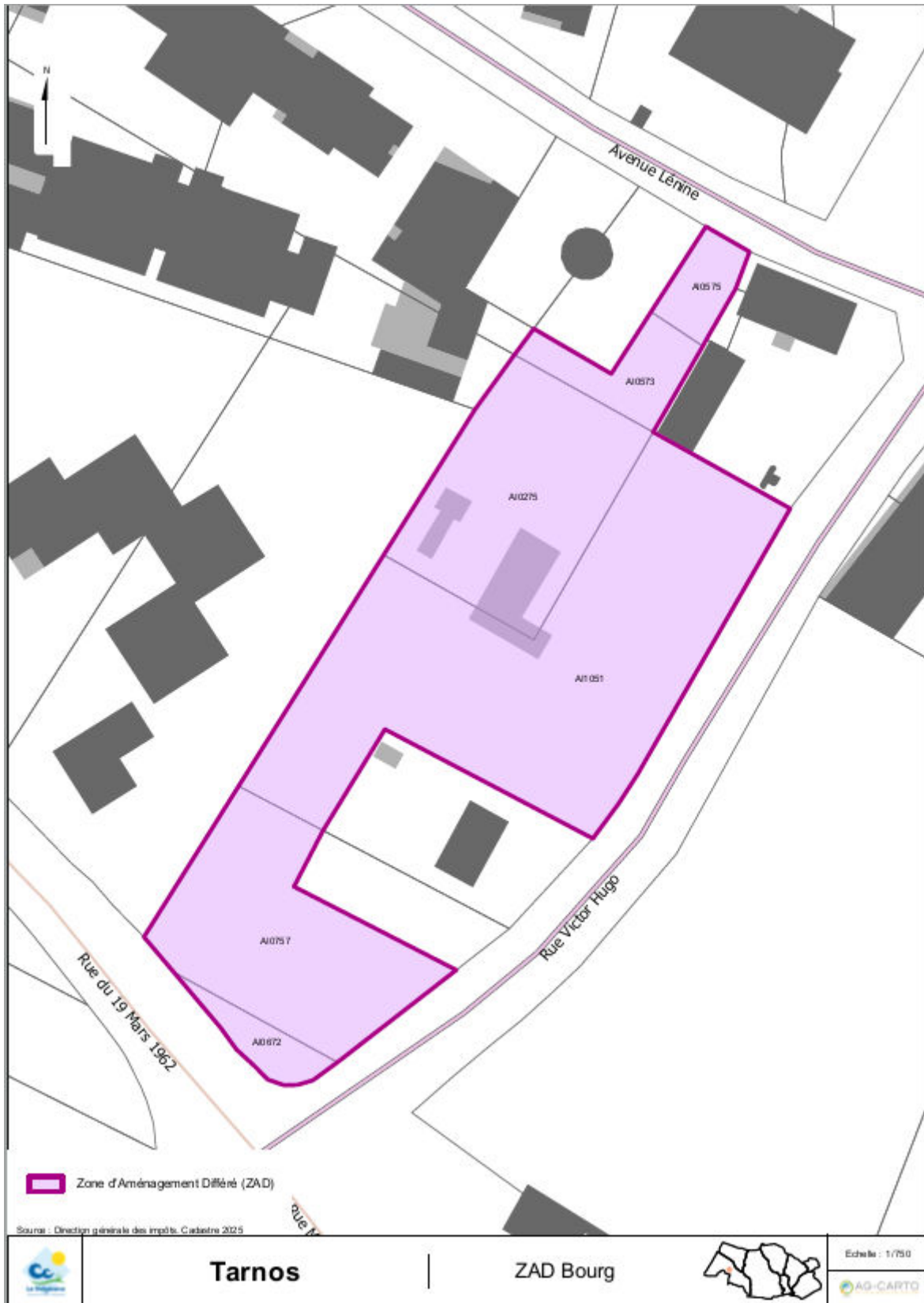
Périmètre de la ZAD de Victor Hugo