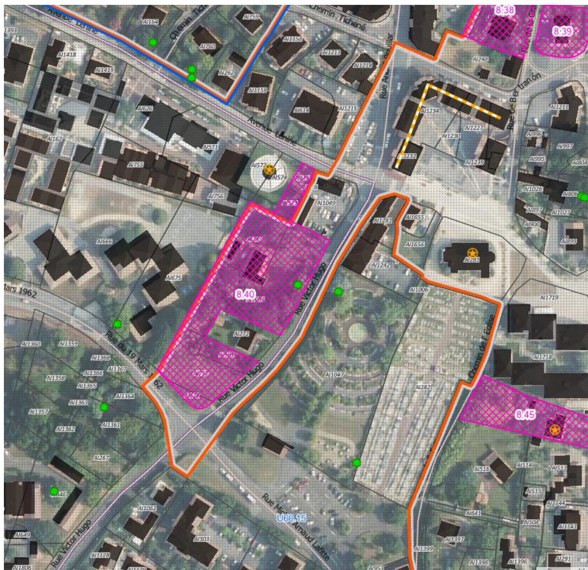
Extrait : PLUi arrêté en date du 5 février 2025