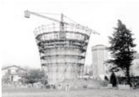
1969 - Construction du château d'eau de Tarnos.

D'où vient l'eau de nos robinets ? Depuis quand avons-nous l'eau courante ? Comment en aurons-nous demain ?