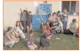
Fiers de leurs oeuvres.

Dans le cadre du partenariat entre la Résidence Tarnos Océan (RTO) et le Centre de Loisirs, le groupe des Grands a fabriqué de grands jeux en bois dont un, a été offert aux résidents. Le groupe des moyens a, quant à lui, mis en place un jeu par équipes mixtes, autour de la sensibilisation au handicap, au travers d'ateliers nécessitant la complémentarité et la solidarité active. Jeu qui a plu, tant aux enfants qu'aux adultes, qu'ils soient à pied ou en fauteuil.