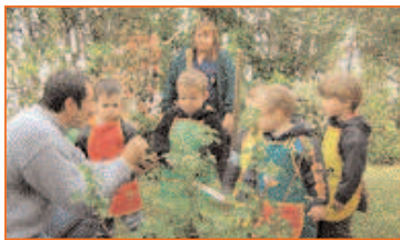
Des apprentis attentifs

Depuis fin avril, équipés de bottes, gants et tabliers, les enfants de la crèche "les Petits Matelots" s'adonnent aux joies du jardinage.