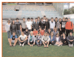
Les jeunes sportifs

Devant le succès rencontré l'an passé, cet été, le service municipal des Sports a reconduit le cycle de perfectionnement physique destiné aux jeunes sportifs licenciés de 15 à 17 ans. Cette structure accueille du 15 juin au 12 août 40 jeunes (28 l'an passé), garçons et filles, issus de différents clubs sportifs, qui bénéficient d'une préparation physique originale visant à améliorer leurs performances sportives.