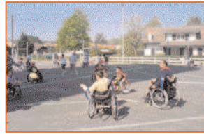
Lors de la journée Riolympique

Attention, la saison estivale va bientôt commencer, du lundi 6 juillet au vendredi 31 juillet puis du mercredi 05 août au vendredi 28 août. Pensez à venir participer à la réunion de présentation des programmes le mercredi 1 er juillet 2009, au Centre de Loisirs André Duboy. Et à vous inscrire pour l'année 2009-2010 (du 02.06.09 au 27.06.09), il ne vous restera qu'une semaine pour le faire, celle du 24 au 28 août !