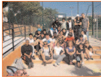
La rencontre avec les jeunes marseillais

Esquisses de sourires en évoquant les souvenirs. Les uns de se remémorer leurs péripéties marseillaises, les autres de revoir leurs prouesses au lancé de flèches à Sarlat. Les parents quant à eux ont pu mettre des images sur les récits de leurs enfants et découvrir leurs progénitures comme ils ne les ont que rarement vues. Ce moment de convivialité et d'échange s'est clôturé autour d'un verre de l'amitié en se promettant de se retrouver, pourquoi pas, dès cet été dans les camps qui sont déjà programmés (Carcans Maubuisson, Ile d'Oléron, Pissos, Puy du Fou, Oloron Sainte Marie). D'ailleurs, certains d'entre eux ont déjà réservé leurs places.