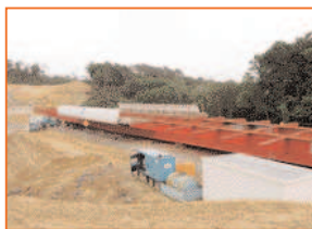
Les travaux du nouveau pont

1000 tonnes, 93 mètres de longueur, 5,5 m de hauteur. Voici les "mensurations" du nouveau pont qui a été installé le 27 mai dernier dans la nuit au dessus de l'A63 au niveau de l'échangeur d'Ondres.