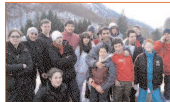
Le séjour à Piau Engaly avait déjà l'an dernier connu un véritable succès.

Quant au « local jeunes » de Castillon, sachez qu'il restera ouvert du mardi au samedi de 14h à 18h ! Renseignements : 05 59 64 32 15 ou jeunesse@ville-tarnos.fr