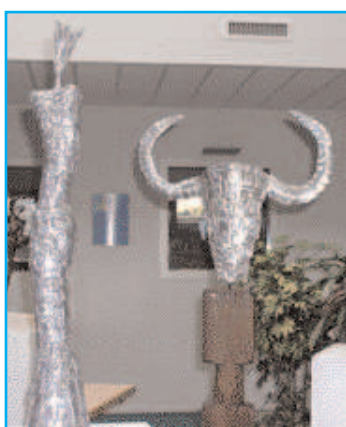
Le sculpteur Hervé le Goff était l'an dernier l'invité d'honneur du salon

Le cercle des Amis de l'Art organise son 19 ème Salon de Printemps dans les salons de l'Hôtel de Ville du 30 mars au 13 avril 2008 .