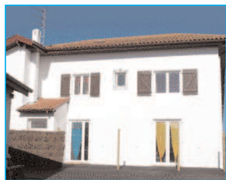
Réhabilitation à TARNOS, de deux T3 en duplex

Renseignements auprès du PACT des Landes HD (Katia HARISTOY) au 05 58 90 90 51 ou lors des permanences organisées les 1 er et 3 ème lundis de chaque mois à la Communauté de Communes (de 14h00 à 16h00), Maison Clairbois à Saint-Martin-de-Seignanx.